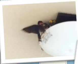
▲えさを与える親鳥

倉庫裏を改装してからしばらく来ていなかったツバメが今年は巣を作り4匹の元気な赤ちゃんが生まれました！