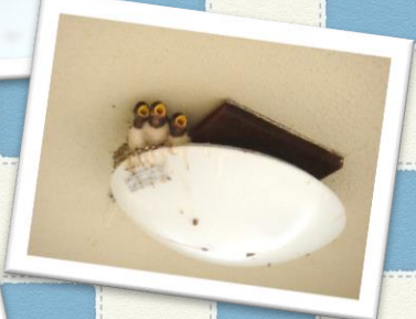
▲力いっぱいえさをねだる雛達