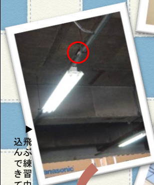
飛んで練習中に倉庫に迷い