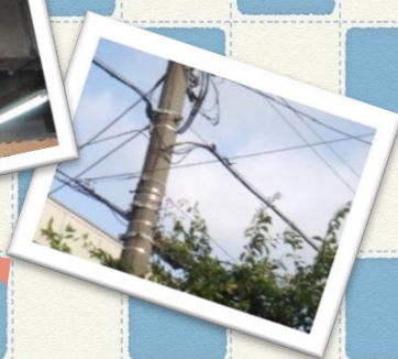
▲[写真左]暫く倉庫内を飛び回った後空へ巣立っていきま