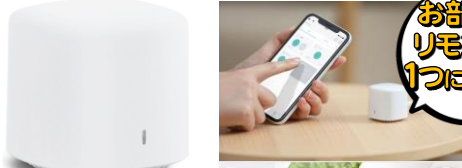
アイリスオーヤマ スマートリモコン SMT-RC1 ※オープン価格