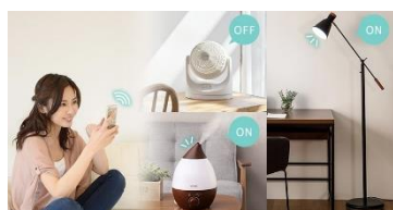
アイリスオーヤマ スマートプラグ SMT-PL1 ※オープン価格