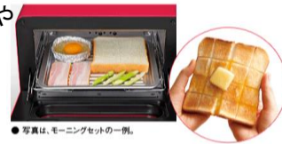
写真は、モーニングセットの一例。