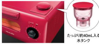
たっぷり約40mL入る水タンク

その①たっぷりの過熱水蒸気で、焼きたてのような美味しさにタンクに水を入れて、庫内にパンを入れたら準備完了。食材の中心までしっかり加熱しながら表面を素早く焼き上げ。昨日買ったクロワッサンも、外はサクサク、中はふんわり。焼きたてのような美味しさを復元します。