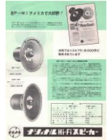
▲Panasonicのブランド名で輸出された8P-W1(通称「ゲンコツ」)

現在、家電メーカーとして知られているPanasonic(旧:松下電器産業)元はといえば1955年に輸出されたスピーカーのブランド名が由来だという。海外で「National」の商標が登録されていたこと、「ナショナル」という響きが「国家主義」と取られかねないために海外向けのブランドとして制定された。「全ての」の意のギリシア語「PAN」と「音」を意味する英語「SONIC」が語源で「松下電器の音をあまねく世界へ」という意味が込められている。