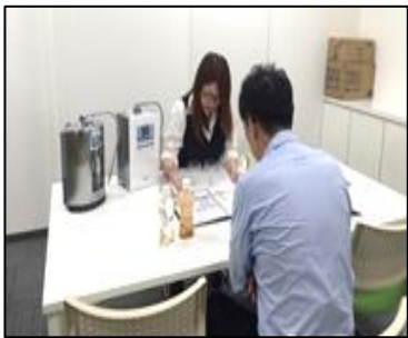
▲水素水の説明を受ける販売店様

8月某日、久保田電機正面スペースにて水素水の効能を実際に体感していただく水素水体験会が開催されました。