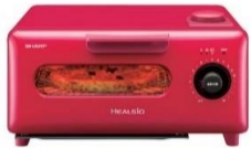
シャープ ヘルシオグリエ AX-H1-R

上記以外にも、買って来た惣菜のリクック(温め直し)や、からあげなどのノンフライ調理にも大活躍!