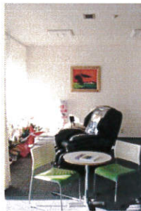
くつろぎのマッサージ体験コーナー

また室内には6台のマッサージチェアが常設され、奥には広々とした商談スペースも設けられております。是非ともお得意先様もお誘いの上、マッサージチェア体験スペースとしてどうぞご利用ください。(※要予約の為、事前に担当営業までご連絡下さい)