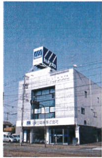
フェニックス通りから見た本社

久保田正面玄関 リニューアルオープン 先日、本社の正面が改装され、久保田電機第二の入口としてリニューアルオープンしました。これまで照明センター、そしてauショップとして慣れ親しまれてきた正面スペース。新たに正面上部と扉に社名が掲げられたことで表通りから見た久保田電機存在感がアップし、営業事務所との間にあった壁が全面ガラス張りになり、フォームされ、明るく開放的な空間へと生まれ変わりました。